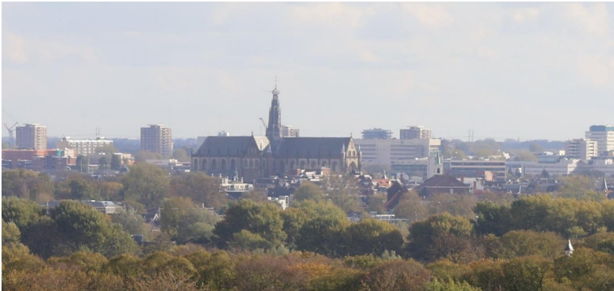
Foto vanaf Het Kopje genomen

Maar klopt dat allemaal? Nee! Foto’s van de Grote Kerk, genomen vanaf Het Kopje tonen aan dat er een veel groter zichtveld is. Dit doet vrezen dat er wel meer niet klopt en dat het geenszins zeker is dat de zichtlijn niet wordt aangetast als er een toren van 20 meter op WR1 komt te staan!